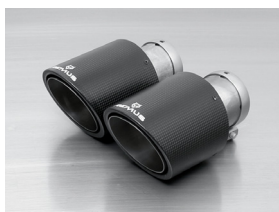
φ102 カーボンアングル左右