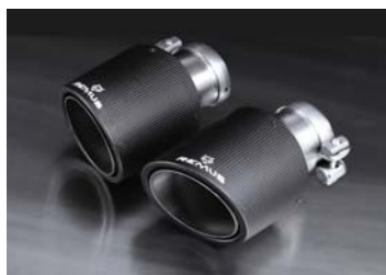
φ102 カーボンアンクル 左右