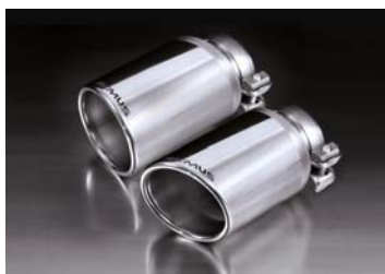
φ102 アンクル 左右