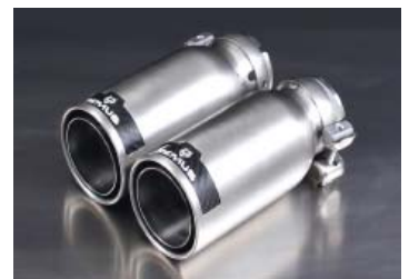
φ98 ストリートレース ブラック 左右