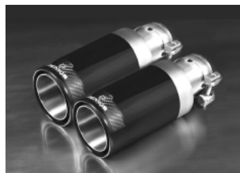
φ98 ストリートレース 左右