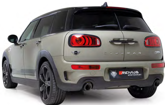
Mini Clubman Cooper S F54 2,0l