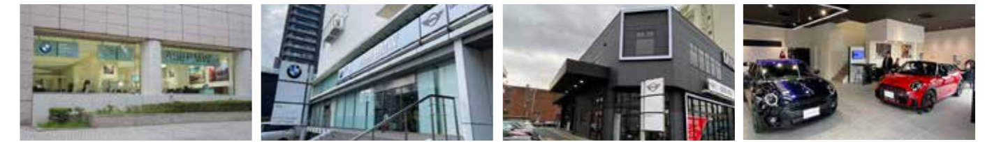
BMW Premium Selection 品川