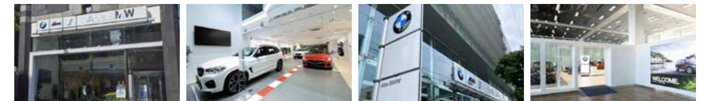
Abe BMW 麻布ショールーム